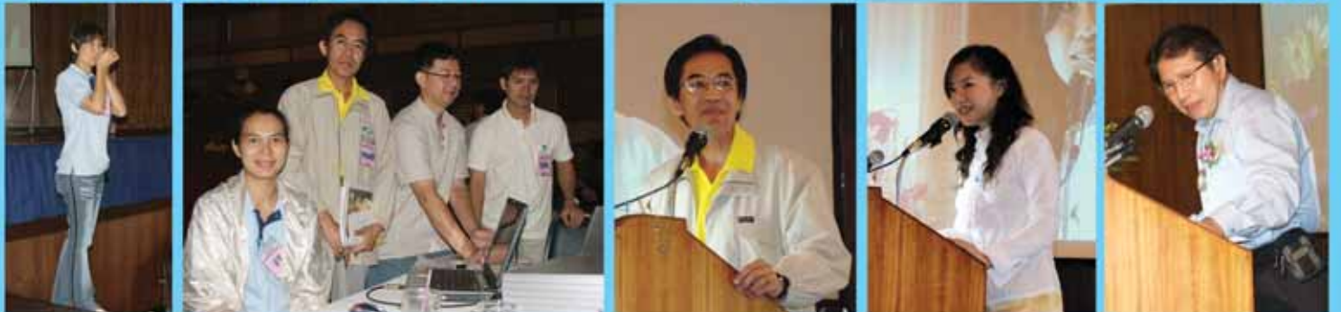
ภาพงานแสดงธรรม-ปฏิบัติธรรมเป็นธรรมทาน เพื่อถวายเป็นพระราชกุศลแด่พระบาทสมเด็จพระเจ้าอยู่หัว จัดโดย มหาวิทยาลัยเทคโนโลยีราชมงคลกรุงเทพ ร่วมกับ ชมรมกัลยาณธรรม วันอาทิตย์ที่ ๑๕ กรกฎาคม ๒๕๕๐