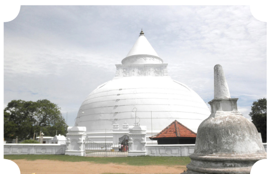
วัดตีสรรมาราชมหาวิหาร

เนื้อหาสาระของพระสูตรกล่าวถึงธรรมหมวด ๖ ประกอบด้วย อายตนะภายใน ๖ อายตนะภายนอก ๖ วิญญาณ ๖ ผัสสะ ๖ เวทนา ๖ และตัณหา ๖ โดยอธิบายต้นตอของพระธรรมเหล่านี้ตามลำดับขั้นตอนจากเบื้องต้นถึงปลายสุด หากมองอีกลักษณะหนึ่งก็เหมือนอธิบายปัจจุสมุปบาทโดยย่อแต่มองอีกด้านหนึ่งเหมือนหลักธรรมปรากฏในอนัตตลักขณสูตร