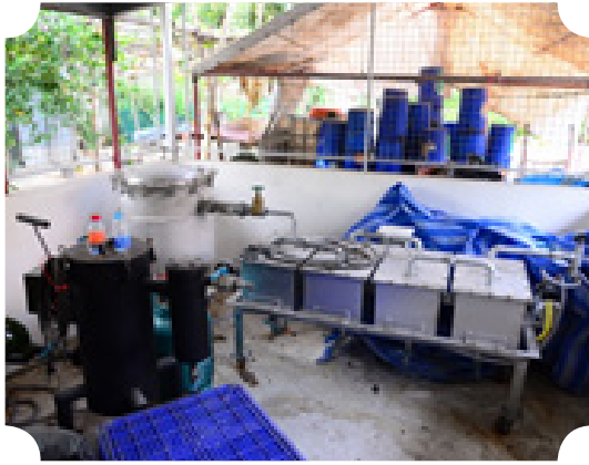
เครื่องทำน้ำดื่มจากขยะเศษพลาสติก

- จัดการโดยการนำกิ่งไม้ ใบไม้ ไปบด แล้วทำเป็นกองปุ๋ยจากวัสดุพืชสด