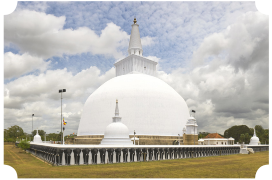
รวันเวฬุและเจดีย์ เมืองเก่าอนุราชปุระ

อันว่าเนื้อความแห่งฉฉกสูตรนั้น พระพุทธองค์ทรงแสดงที่เขตวันมหาวิหาร