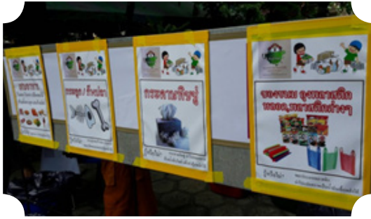
ถังขยะภายในวัด พร้อมป้ายบอกขยะประเภทต่างๆ

ญาติโยมจิตอาสาช่วยแนะนำการทิ้งขยะ และ ช่วยคัดแยก ก่อนนำขยะไปใช้ประโยชน์