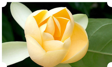
ดอกมณฑาทิพย์

วันรุ่งขึ้น ประชาชนมาร่วมประชุมกันที่วัด และต่างคนต่างก็เข้าใจว่าสมเด็จเจ้าฯ ท่านสำเร็จไปสู่สวรรคต จึงได้พากันพนมมือขึ้นเหนือศีรษะพร้อมเปล่งเสียงว่า สมเด็จเจ้าพะโคะหายไปแล้วเจ้าข้าเอ๋ย