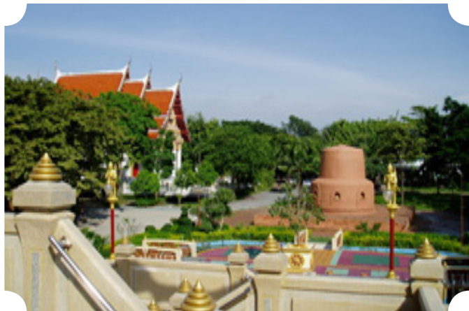
วัดจากแดงในปัจจุบัน (พ.ศ. ๒๕๖๐)

จากปฐมเหตุที่วัดจากแดงประสบกับปัญหาขยะ ที่เกิดจากน้ำในแม่น้ำเจ้าพระยาได้พัดเอาขยะมาติดค้างในบริเวณวัดเป็นจำนวนมาก รวมทั้งปัญหาระบบการจัดเก็บเศษอาหารภายในโรงครัวและห้องน้ที่ไม่มีประสิทธิภาพปัญหาดังกล่าวได้ส่งผลกระทบต่อทั้งหมู่พระภิกษุสามเณร และผู้ที่มาประกอบบุญกุศลที่วัดเป็นอย่างมาก จากแนวคิดสร้างสรรค์จึงนำไปสู่การปฏิบัติที่เป็นจริง โดยพระมหาประนอม ธมฺมาลงกาโร รองเจ้าอาวาสวัดจากแดง ท่านต้องการจะปรับปรุงสภาพแวดล้อมภายในวัดให้มีความสะอาด ร่มรื่น และสวยงามยิ่งขึ้นทั้งแก่ผู้อยู่อาศัยและในสายตาของสาธุชนที่เข้ามาร่วมบำเพ็ญบุญกุศล มาหาความสงบร่มรื่นภายในวัด ท่านจึงได้นำความรู้และประสบการณ์จากการศึกษาดูงาน ทั้งในและต่างประเทศ มา