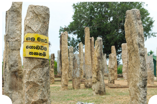
วัดพระเชีวแก้ว เมืองเก่าโปเอนนารูวะ

ประเด็นเพิ่มเติมคือพระอรหันต์สมัยพระมาลัยเทวเถระนั้นมีมากมายมหาศาล ทั้งเป็นชาวศรีลังกาและต่างประเทศ สังเกตได้จากคราววางศิลาฤกษ์สร้างวันแฉปีแฉยะเจดีย์สมัยพระเจ้าพุทธคามณีแห่งอาณาจักรอนุราชปุระนั้น มีพระสงฆ์อรหันต์ชีณาสพชาวต่าง