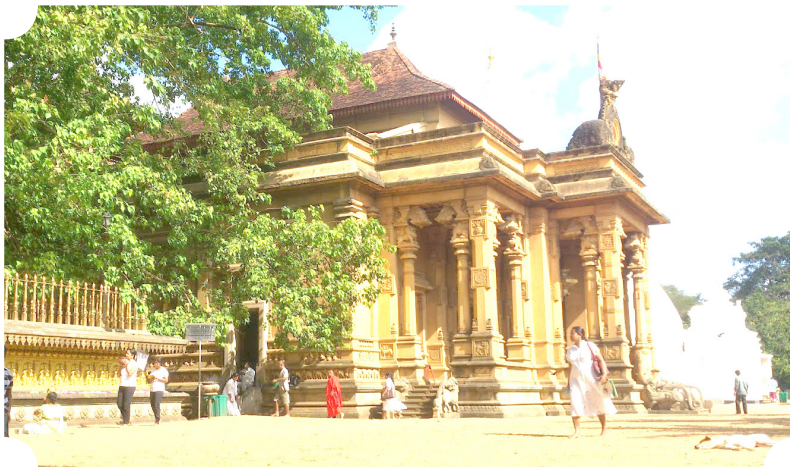
วัดกัลยาณีราชมหาวิหาร

สมัยหลังมักเรียกอีกชื่อหนึ่งว่าทักขินเทศะ หมายถึงดินแดนตอนใต้ว่ากันว่ายามบ้านเมืองตกเป็นของอริราชศัตรูภายนอก กษัตริย์สิงหลหลายพระองค์มักมาชุมนุมหน้ราชภัยบริเวณนี้ ก่อนที่จะรวบรวมผู้คนกอบกู้บ้านเมือง