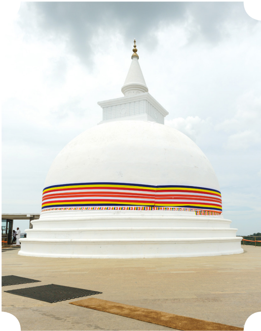
เจดีย์บริวารรอบบวรวันเวฬุและเจดีย์เมืองเก่าอนุราชปุระ

หลักฐานไม่ได้บอกว่าใครเป็นพระอุปัชฌาย์ ระบุแต่เพียงว่าครั้งบรรพชาครบ ๓ พรรษา ได้ไปพำนักอาศัยในมหินทลารามวิหาร โดยอุบาสิกาท่านหนึ่งเป็นผู้นิมนต์