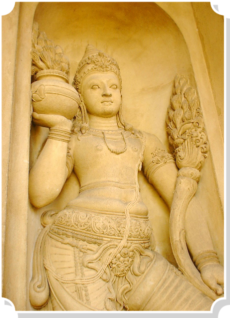
เทพารักษ์หน้าวิหารวัดกัลยาณมิตรราชมหาวิหาร

ประเพณีชาวอีสาน เวลาถึงงานมงคล โดยเฉพาะทำบุญอุทิศแก่ผู้ล่วงลับดับสังขาร นอกจากนิมนต์พระเจ้าพระสงฆ์มาเจริญพุทธมนต์ฉันเช้าแลเพลแล้ว สิ่งหนึ่งซึ่งเป็นองค์ประกอบที่ขาดไม่ได้คือผ้าขาวผืนใหญ่ กางกันไว้ด้านหลังพระสงฆ์ เสมือนหนึ่งผ้าม่าน บนเนื้อผ้าแต่งแต้มเรื่องราวเกี่ยวกับพุทธศาสนา ไม่ว่าจะเป็นพุทธประวัติ นิทานชาดกเกี่ยวกับพระโพธิสัตว์ หรือแม้แต่เรื่องพระเวสสันดรชาดก อันเป็นเรื่องการสร้างมหาบารมีครั้งสุดท้ายของพระโพธิสัตว์