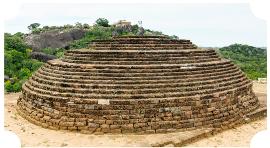
วัดลิตุลเพาวะวิหาร

แต่อย่างไรก็ตามไม่ว่าจะปฏิเสธสิ้นเชิงเลยทีเดียว เพราะธรรมชาติของประวัติศาสตร์ย่อมไม่สมบูรณ์ตายตัว トラบใดที่หลักฐานเหล่านี้ยังไม่มีการค้นพบ บางทีในอนาคต