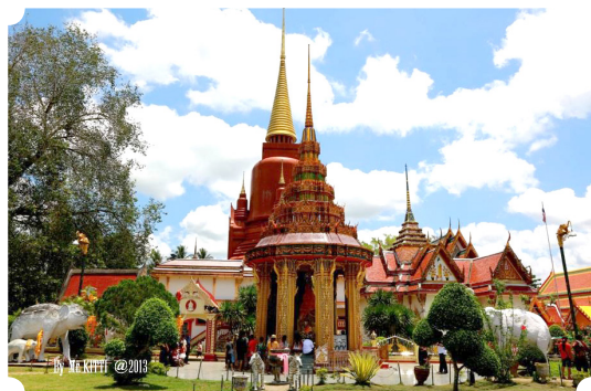
วัดช้างให้ (วัดราชบูรณะ) อ.โคกโพธิ์ จ.ปัตตานี

เมื่อพระยาแก้วดำปลุกสร้างเมืองให้น้องสาว และมอบพลบริวารให้ไว้พอสมควรเรียบร้อยแล้วก็ให้ชื่อเมืองนี้ว่า เมืองปะตานี (ปัตตานี) ขณะนั้น พระยาแก้วดำเดินทางกลับมาถึงภูมิประเทศที่ช่างบอกให้ครั้งแรก