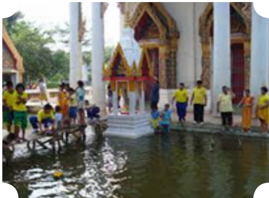
วัดจากแดงในอดีต (พ.ศ. ๒๕๕๐)