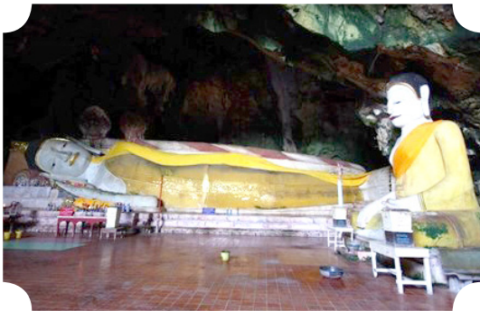
พระพุทธไสยาสน์ วัดคูหาภิมุข (วัดหน้าถ้ำ) อ.เมือง จ.ยะลา

มีเรื่องทำให้ชวนคิดว่าวัดที่ท่านลังกาอยู่ถึงเมืองไทรบุรี ระยะทางที่จะมาวัดช้างให้ไกลมาก ทางเดินก็มีแต่ป่าและภูเขา แสนจะทुरกันดาร ท่านลังกามีวัยชรามากแล้ว จะเดินไปเดินมาไหวหรือ แต่ผู้เฒ่าผู้แก่เล่าต่อกันมาว่า ท่านลังกาเดินทางไปมาแบบตรงๆระหว่างวัดทั้งสองนี้ เดินทางเวลาแรมเดือน