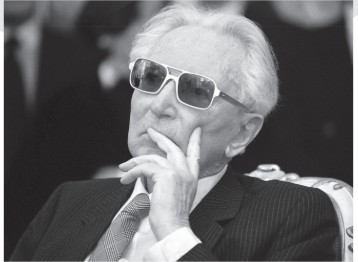
คุณหมอ Viktor Frankl

วันที่ ๑๐ กันยายนของทุกปีเป็น “วันป้องกันการฆ่าตัวตายโลก” (World Suicide Prevention Day) องค์การอนามัยโลกประมาณการว่า ในแต่ละปีมีผู้เสียชีวิตด้วยการฆ่าตัวตายมากกว่า ๘๐๐,๐๐๐ ราย หรือ เฉลี่ย ๑ คนในทุกๆ ๔๐ วินาที