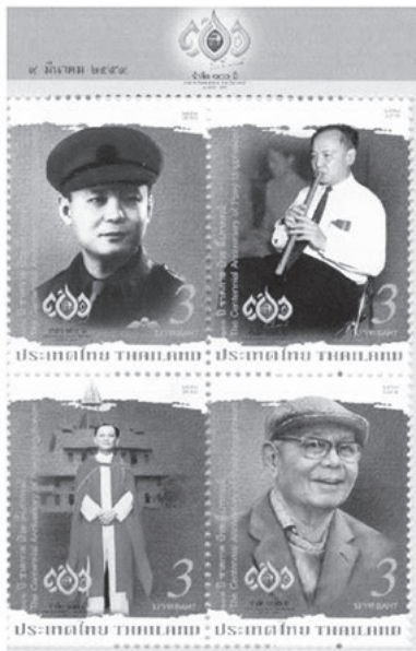
แสตมป์ ที่ระลึก 100 ปี ชาตกาล ปวย อังการณ บุคคลสำคัญของโลก

“ดร.ปวยได้รับการยอมรับอย่างกว้างขวางว่าเป็นบิดาแห่งการพัฒนาเศรษฐกิจไทย ยุคหลังสงครามโลกครั้งที่ ๒ อีกทั้งเป็นนักการศึกษาและข้าราชการที่โดดเด่นและมีจริยธรรมตัวอย่างหาที่ติมิได้ จนเป็นที่ยอมรับว่ามีอิทธิพลอย่างมากในการพัฒนาประเทศชาติ ท่านเป็นแกนกลางในการวางรูปแบบของการพัฒนาเศรษฐกิจของไทย และในการปรับปรุงระบบการศึกษาขั้นสูงของประเทศ ใช้ความรู้ ความสามารถของท่านในการทำงานทุกชิ้นให้สำเร็จได้อย่างถูกทำนองคลองธรรม เป็นความสำเร็จที่น่าชื่นชมเป็นพิเศษ