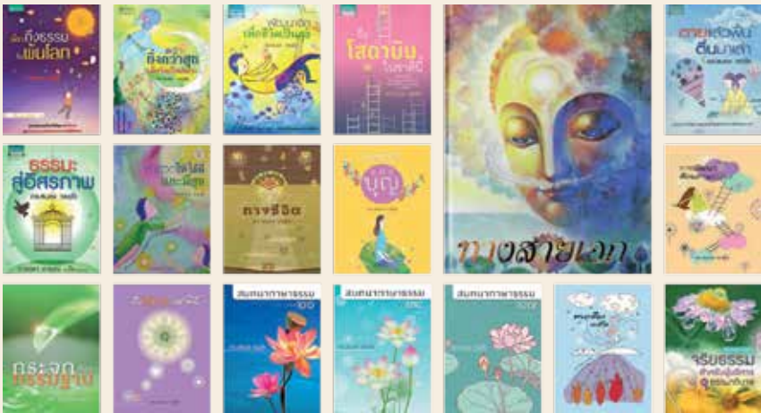
ตัวอย่างผลงานหนังสือธรรมะ และการแสดงธรรมบรรยายของ ท่านอาจารย์ ดร. สอนอ วรอุไร