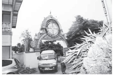
วัดเม็งคลาใต้ (ใหม่)