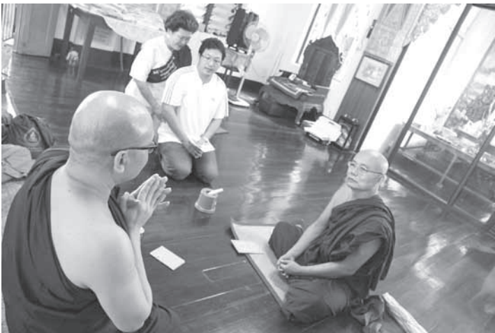
ท่านเจ้าอาวาสองค์ปัจจุบัน