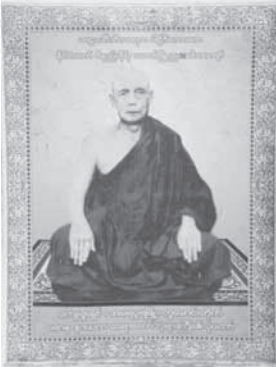
ท่านอาจารย์ภัททันตะนันทิยะเถระ อดีตเจ้าอาวาส