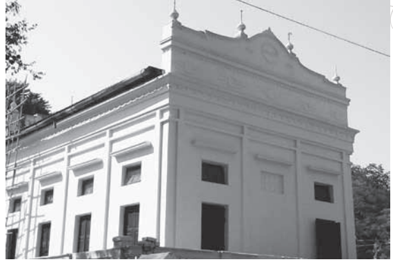
อุโบสถสีมาหลังใหม่ในเขตสีมาเดิมของวัดวาโชใต้

อาวาสวัดวาโชใต้ คือ ท่านภททันตะกุมารส่วนน้องชายคนเล็กของท่านพระอุปัชฌาย์ ได้ตั้งฉายาให้ว่าสามเณรธัมมิกะ สามเณรโชติกะเป็นผู้ใคร่ใฝ่ในการศึกษามากและประพฤติอุปัชฌาย์วัตรมิได้ขาดและได้ศึกษาพระปริยัติธรรมมีคัมภีร์กัจจายนะ อภิธัมมัตถสังคหะเป็นต้น โดยตรงจากท่านภททันตะกุมารผู้เป็นพระอุปัชฌาย์ ในสมัยนั้นวัดวาโชใต้เป็นสำนักเรียนพระปริยัติธรรมมีนักศึกษาประมาณ ๕๐ รูป ๔