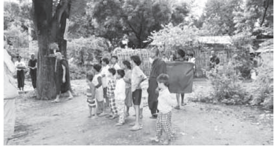
บริเวณบ้านเกิดของท่านพระอาจารย์สัทธัมมโชติกะ ปัจจุบันได้ขายบ้านไปแล้ว มีต้นไม้ ชื่อว่า “ตะมุง” (ภาษาพม่า) หรือ ต้นแจง (ภาษาไทย) เป็นสัญลักษณ์ใน การจดจำ