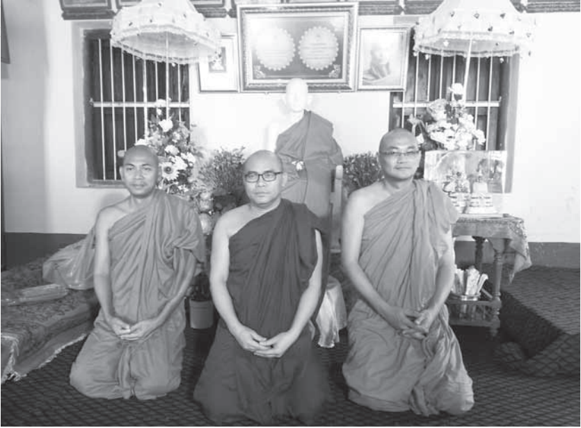
พระนรมย์ วิสารโท พระมหาฉลาด จักกวโร พระบัณฑิต ญาณธีโร คณะผู้สืบเสาะค้นหา และเรียบเรียงประวัติท่านพระอาจารย์สีทธัมมโชติกะ