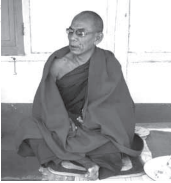
ท่านภัททันตะอิสสระเถระ ผู้เป็นลูกพี่ลูกน้องของ พระอาจารย์สัทธัมมโชติกะ ผู้ให้ข้อมูล