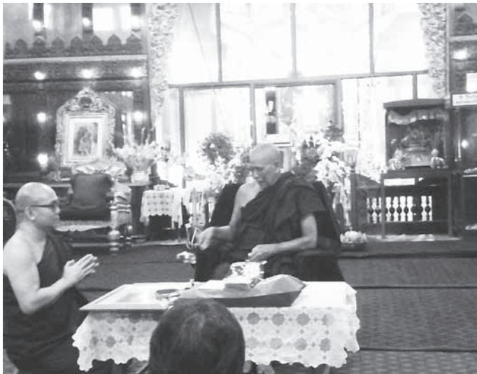
ท่านอาจารย์ภักทันตะวิจาระอัครมหาบัณฑิต ทำหน้าที่เป็นคณะปาโมกข์ วัดมหาวิสุตาราม (เจ้าอาวาส)