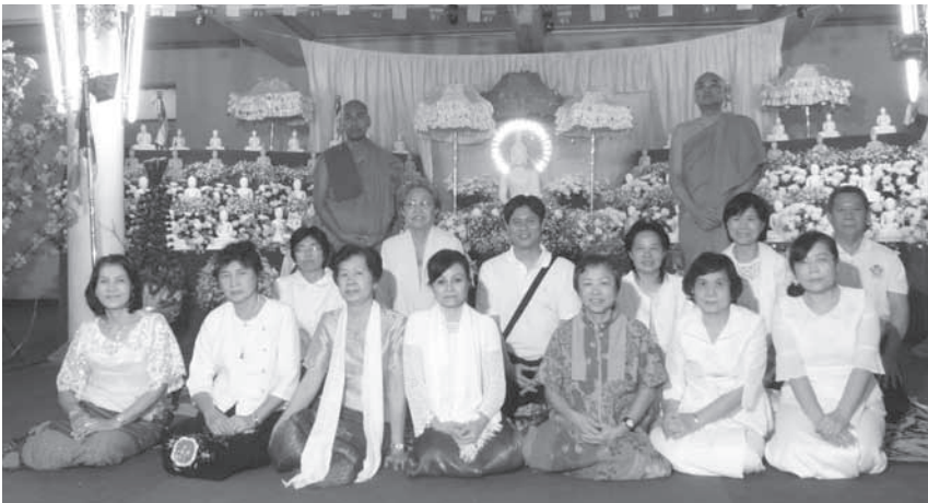
คณะผู้ร่วมเดินทางไปร่วมงานอาจารย์บูชา ๑๐๐ ปี ชาตกาล ของท่านพระอาจารย์สีทธัมมโชติกะ ที่ประเทศเมียนมาร์