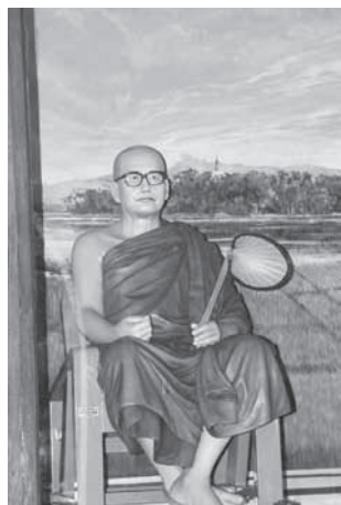
ท่านอาจารย์ภัททันตะชนกาภิวัังสะ รูปจำลอง