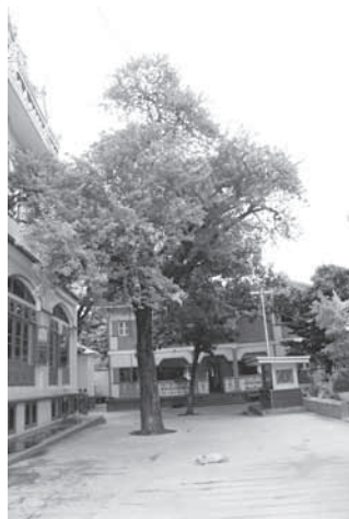
ภายในวัดมหาคันธายง