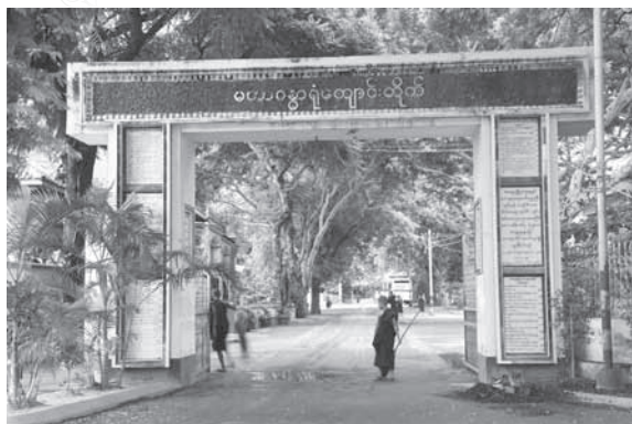
ซุ้มประตูวัด