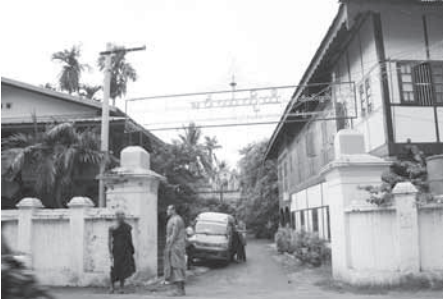
วัดเม็งคลาใต้ (เก่า)