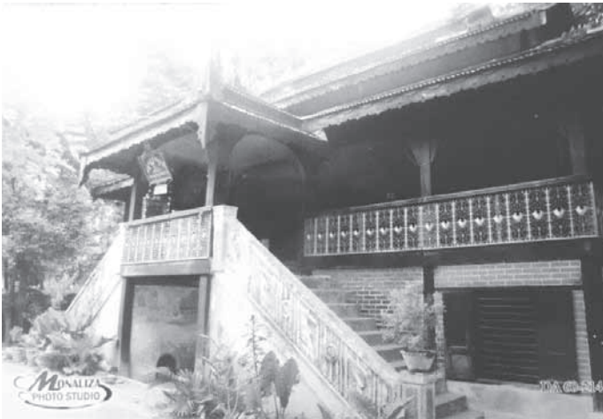
กุฏิธัมมเม็งชู (ธัมมมัญชู) ที่พระอาจารย์สัทธัมมโชติกะเคยพักอาศัย ปัจจุบันทางวัดได้รื้อทิ้ง และได้สร้างหลังใหม่ขึ้น