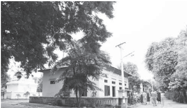
ภายในวัดตูมองใต้