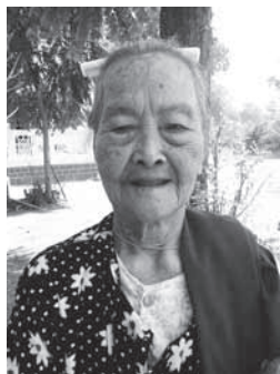
มะฮุ้นจิง