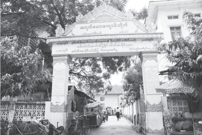
ซุ้มประตูวัดตะแยะด้อใต้