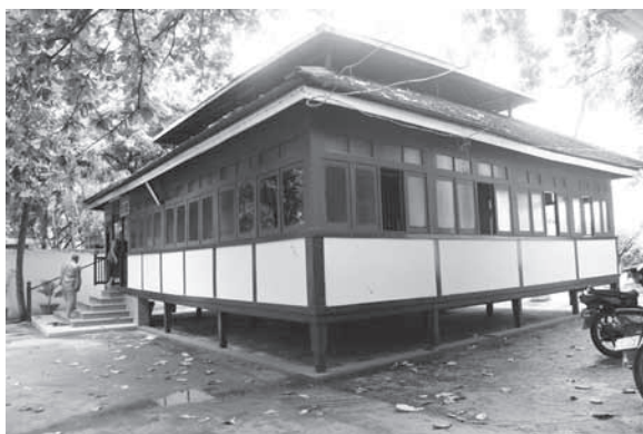
กุฏิของท่านอาจารย์ภัททันตะชนกาภิวัังสะ ปัจจุบันทางวัดได้ทำเป็นพิพิธภัณฑ์ของท่าน