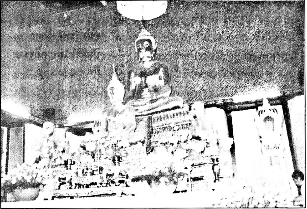
พระประธานในพระอุโบสถ วัดสังเวชวิศยาราม